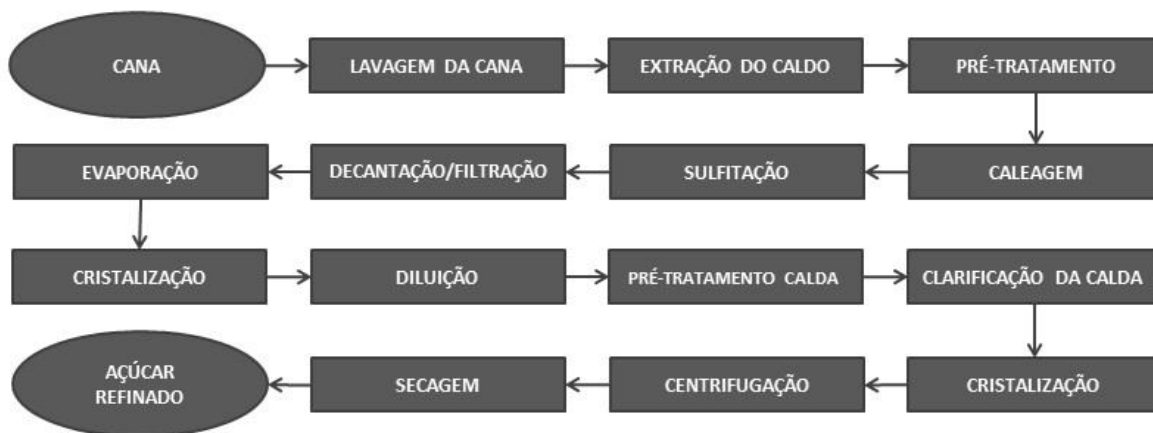
Figura 2 – Fluxograma do processo de tratamento do caldo uma unidade produtora de açúcar refinado.

Mezaroba; Meneguetti; Groff (2010) acrescentam que, da parte mais fina da peneiração, é extraído o açúcar de confeitaria e, do restante, o açúcar refinado. Ainda existe uma separação entre o açúcar refinado: o açúcar que possui cristais bem definidos e granulometria homogênea é chamado de açúcar refinado granulado e o açúcar com granulometria mais fina é titulado açúcar refinado amorfo.